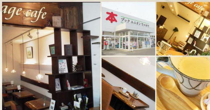
※画像をタッチすると大きな写真が見られます。

高畠駅前通りの本屋です。そして本屋の中にこっそりとOPENしたのが隠れ家みたいな page cafe 深煎り豆をイタリア製の加圧抽出マシンで淹れた香り高いコーヒーでゆったりとした時間をお楽しみ下さい。 コーヒーが苦手の方には、ココアやジュース、抹茶ラテ等もごございます。 カフェのみのご利用はもちろん、テイクアウトもご用意しておりますので高畠町散策の途中に、お仕事帰りにちょっと一息ついてみませんか？