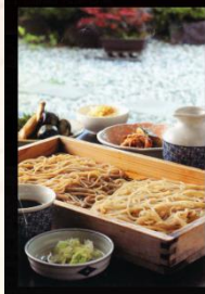
十割・二八そばの盛り合わせ