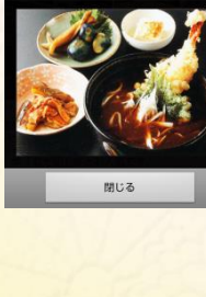
えび天カレーそば