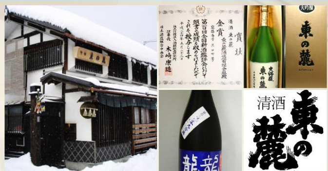
※画像をタッチすると大きな写真が見られます。

「飲む人の心を満たす酒」「地元で愛される地酒」を大切に考え南陽市宮内で地酒製造を行っております。冬の寒い時期に仕込まれた日本酒は、新酒や季節限定品として楽しんでいただけます。