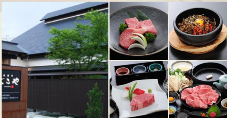
※画像をタッチすると大きな写真が見られます。

古民家風の趣の中で米沢牛三昧。 落ち着いた和の空間でいただく牛肉料理。 個室風の間仕切りでゆったりとお楽しみ下さい。